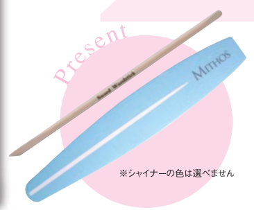
※シャイナーの色は選べません