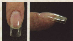
軟性凝膠指甲 側面圖