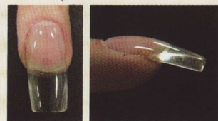
硬性凝膠指甲 側面圖

軟性凝膠的特色是比硬性凝膠柔軟，可以使用丙酮溶解。因素材關係，在長度有所限制，有的廠商的產品之指甲長度限制在5mm左右。與硬性凝膠相較，亮澤感較差，有的廠商的產品甚至會有泛黃現象。建議大家根據素材的不同與用途，分類使用水晶指甲材料、硬性凝膠與軟性凝膠。綜合來講，光療凝膠指甲不會有剝離、浮起之虞，而且可以常保美麗亮澤感與透明感，且對指甲負擔輕，非常舒適。也不需要太多的削磨作業，對於施術者而言，作業負擔輕。