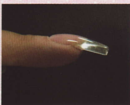
指甲兩側直線修整